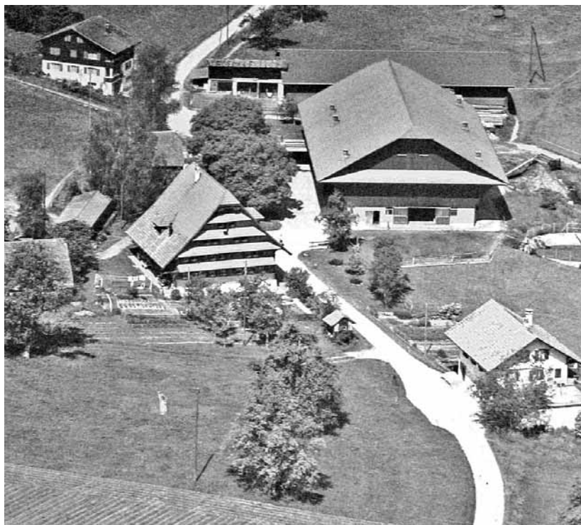
Hof Gastfamilie in Willisau