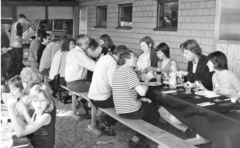
Gastfamilientreffen in Ruppoldsried